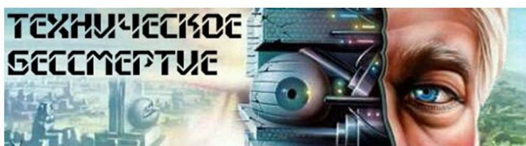
Рис. 1. Логотип клуба РТД «Техническое Бессмертие».

«Рад приветствовать вас в интеллектуальном клубе "Техническое бессмертие"!